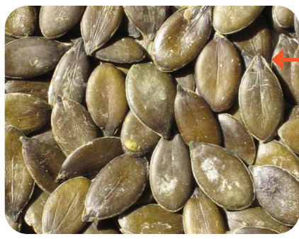
Écailles lisses symbolisées par les graines de courge

Rassemblez le matériel suivant, en fonction du nombre de participants à cette activité : argile ou pâte à modeler, graines de courge, graines de tournesol striées (entières), contenants pour les graines, colle.