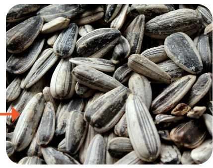
Écailles carénées symbolisées par les graines de tournesol