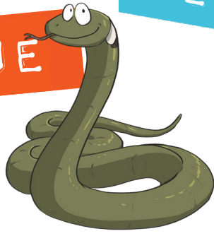
Bertrand, le Serpent

Vous souhaitez travailler autour de la symbolique liée au Serpent ? Voici quelques légendes, contes et expressions populaires au sujet cet animal.