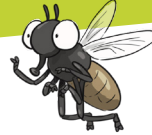
Imagène, la Mouche